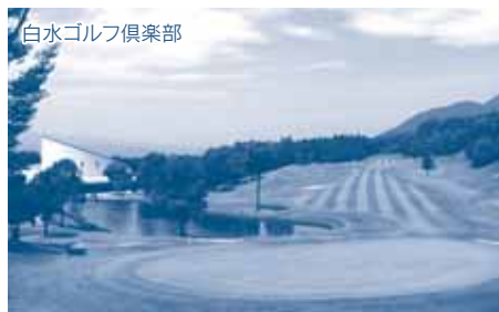
白水ゴルフ倶楽部 ※県市町村対抗の本選は9月26日(火)開催