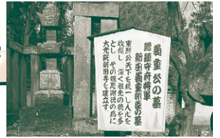
【大光院裏 新田の始祖 新田義重御廟前看板】